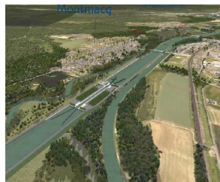
Légende : représentation du Canal SNE au niveau de Montmacq

Enfin, l'enquête publique sur le dossier d'autorisation environnementale est prévue au 2 ème trimestre 2020.